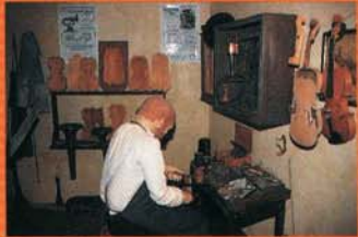
Einblick in die Geschichte: Das Kuseler Musikantenland-Museum auf Burg Lichtenberg.