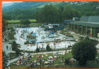
Neben dem Hallenbad in Kusel gibt es auch noch ein großes Freibad.

Die Veste, von den Grafen von Veldenz im zwölften Jahrhundert erbaut, wurde teilweise durch Brand zerstört. Im Zehnhaustaus befindet sich heute neben einem großen Veranstaltungssaal das Musikantenland-Museum, das einen interessanten Einblick in eine wichtige geschichtliche Begebenheit der Region gibt. Es hält die Erinnerung an das Wandermusikantengewerbe der Westpfalz wach. Zahlreiche Schaustücke und Originalmusik lassen das Leben der rund 2.500 Männer wieder lebendig werden, die bis vor dem zweiten Weltkrieg in aller Welt mit Musik ihr Geld verdienten. Daneben zeigt das Naturkunde-Museum, eine Zweigstelle des Pfalzmuseums für Naturkunde Bad Dürkheim, abwechslungsreiche Ausstellungen. Vom Turm der Burg hat man einen herrlichen Blick auf die Region der Westpfalz.