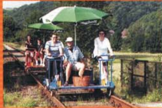
Draisinenfahrt durch das Glantal.

Die Kreisstadt Kusel ist Heimat des unvergessenen großen Tenors Fritz Wunderlich. Sie liegt eingebettet in der abwechslungsreichen Hügellandschaft des Pfälzer Berglandes. Aus allen Richtungen ist die kleine Stadt über die Bundesstraßen zu erreichen, und auch mit der Bahn kann man hier her anreisen. Erholungssuchende und Wanderer, die in einer von Wiesen und Wäldern umgebenen Kleinstadt etwas erleben möchten, finden bequeme Wald- und Wiesenwege für erholsame Spaziergänge und herrliche Wanderungen. So erreicht man mit einer leichten Bergwanderung den Remigiusberg mit der Ruine Michelsburg und einer kleinen Kirche, deren romanische Teile aus dem zwölften Jahrhundert stammen. Dicht bei Kusel liegt oberhalb des kleinen Ortes Thallichtenberg die Burg Lichtenberg. Sie gehört zu den größten Burgruinen Deutschlands mit einer