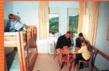
In den modern ausgestatteten Zimmern der Jugendherberge fühlen sich alle Gäste wohl.