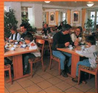
Die moderne und gemütliche Jugendherberge ist ein Renner bei Familien.