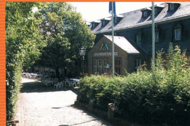
Die sehr moderne Jugendherberge auf Burg Lichtenberg. Alle Zimmer mit Dusche/WC