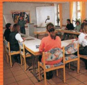
Modern ausgestattete Räume bieten ideale Möglichkeiten für Schulklassen, Jugendgruppen, Seminare, Tagungen und Workshops.